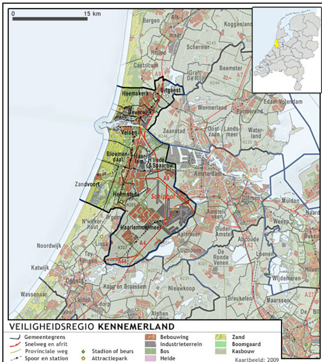
Figuur 2: De Veiligheidsregio Kennemerland

De Veiligheidsregio Kennemerland (VRK) is een van de 25 veiligheidsregio's in Nederland. De VRK voert diverse veiligheidstaken uit namens tien gemeentebesturen in het zuidwesten van de provincie Noord-Holland: Beverwijk, Bloemendaal, Haarlem, Haarlemmerliede & Spaarnwoude, Haarlemmermeer, Heemskerk, Heemstede, Uitgeest, Velsen en Zandvoort. Kennemerland grenst aan de veiligheidsregio's Noord-Holland Noord, Zaanstreek-Waterland, Amsterdam-Amstelland en Hollands Midden.