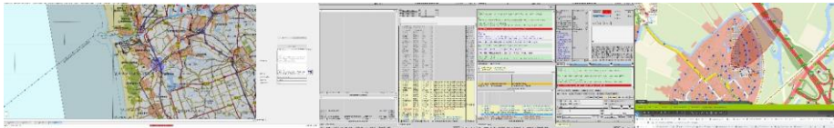
Print screen scherm CaCo, 09.39 uur